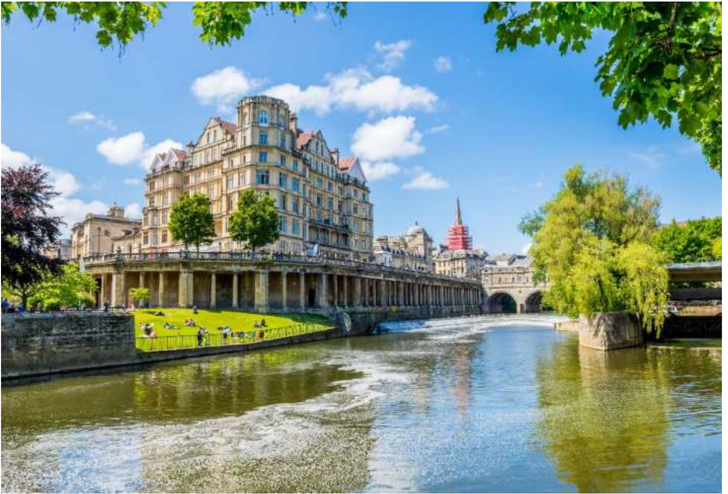
วันที่หก เมืองบาส - มหาวิหารบาส - โรงอาบน้ำโรมันโบราณ - เมืองซาลิสบิวรี - อนุสาวรีย์เสาคินสโตนเฮนจ์ - เมืองลอนดอน (B/-/D)

เช้า บริการอาหารเช้า ณ ห้องอาหารของโรงแรม นำท่าน ถ่ายรูปเป็นที่ระลึก กับ มหาวิหารบาส (Bath Abbey) และ บริเวณด้านหน้าของ โรงอาบน้ำโรมันโบราณ (Roman Baths) ถือเป็นโรงอาบน้ำโรมันขนาดใหญ่ในสมัยโบราณที่ได้รับการอนุรักษ์และดูแลเป็นอย่างดี ซึ่งโรงอาบน้ำของที่นี่อยู่ต่ำกว่าระดับพื้นถนนในปัจจุบัน ภายในแบ่งออกเป็นโซนหลักๆ 4 โซนด้วยกัน ตั้งแต่โซน Sacred Spring, Roman Temple, Roman Bath House และ Museum ซึ่งแหล่งน้ำแร่แห่งนี้ถูกค้นพบตั้งแต่สมัยชาวโรมันบุกเข้ามายึดเกาะอังกฤษ เป็น 1 ใน 7 สิ่งมหัศจรรย์ทางธรรมชาติของทางตะวันตกอีกด้วย ** ยังไม่รวมค่าบัตรเข้าชมสำหรับเด็ก ท่านละ ประมาณ 14.00 ปอนด์ หรือ ค่ารถเป็นเงินไทย ท่านละ ประมาณ 602 บาท / ผู้ใหญ่ ท่านละ ประมาณ 15.00 ปอนด์ หรือ ค่ารถเป็นเงินไทย ท่านละ ประมาณ 645 บาท ขึ้นอยู่กับประเภทของบัตร และ จำเป็นต้องจองก่อนล่วงหน้า เพราะอาจจำกัดจำนวนผู้เข้าชมในแต่ละวันได้ **