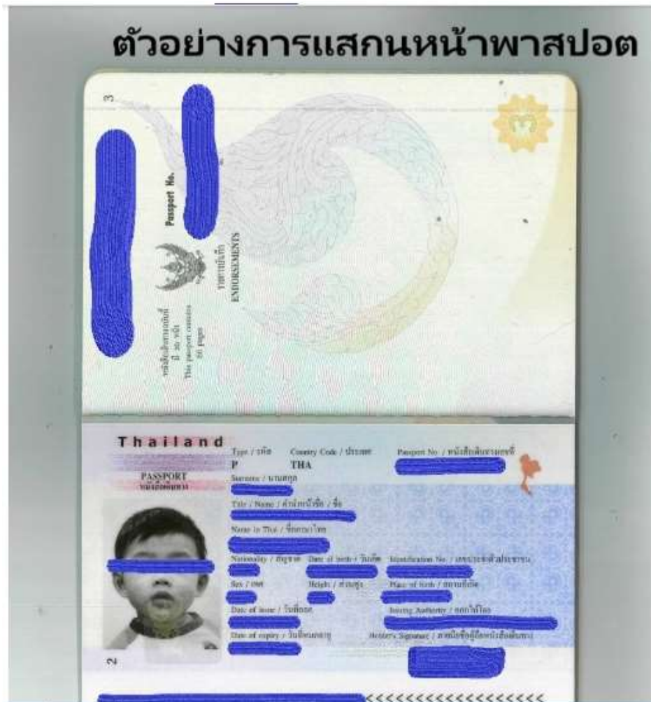
รูปตัวอย่าง ต้องพื้นหลังสีขาวเท่านั้น