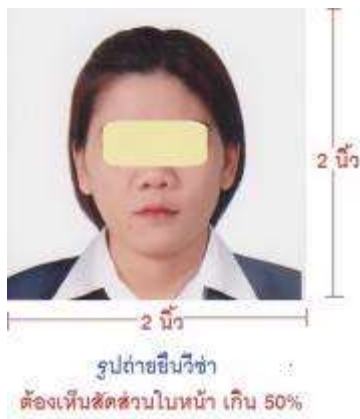
ตัวอย่างรูปถ่ายเพื่อยื่นขอวีซ่า U.S.A.

หนังสือเดินทางของท่าน จะถูกส่งคืนมาที่บ้านท่านทางไปรษณีย์ ตามที่อยู่ที่ยกรอกในแบบฟอร์มไว้