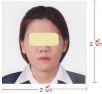
รูปถ่ายขึ้นวีซ่า ต้องเห็นสัดส่วนใบหน้า เกิน 50%

หนังสือเดินทางของท่าน จะถูกส่งคืนมาที่บ้านท่านทางไปรษณีย์ ตามที่อยู่ที่คุณกรอกในแบบฟอร์มไว้