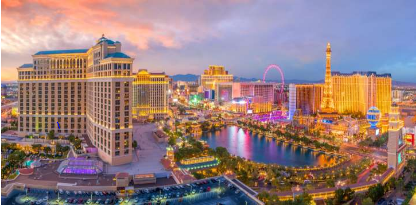
วันที่สี่ เมืองลาส เวกัส - อีสระทองเที่ยว หรือ พักผ่อน ที่เมืองลาส เวกัส ตามอัธยาศัย แบบเต็มวัน (B/-/-)