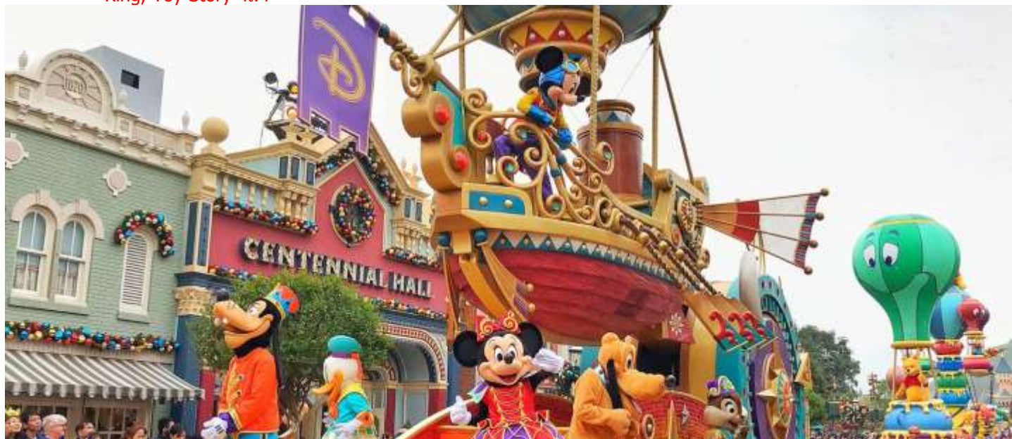
**อิสระอาหารค่ำ ตามอัธยาศัย**

ขบวนพาเหรด ไฟลท์ส ออฟ แฟนตาซี จะจัดแสดงในเวลา 13.30 น. ของทุกวัน โดยสามารถชมขบวนพาเหรดได้ที่ เมนสตรีท ยูเอสเอ (ขึ้นอยู่กับสภาพอากาศ ณ วันนั้นๆ) ชมและเชียร์ตัวละครดิสนีย์ ที่ร่วมขบวนมากมายไม่ว่าจะเป็นตัวการ์ตูนดัง อาทิ Mickey mouse, Minnie mouse, Winnie and the Pooh ตามด้วยเจ้าหญิงแสนสวยจากนิทานหลากหลายเรื่อง อาทิ Snow White, Rapunzel, Cinderella ฯลฯ หรือตัวละครจากภาพยนตร์ดัง อาทิ The Jungle Book, The Lion King, Toy Story ฯลฯ