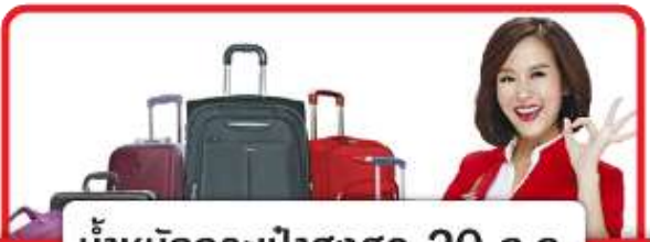
น้ำหนักกระเป๋าสูงสุด 20 ก.ก.

**หากต้องการอัพเกรดที่นั่งรบกวนแจ้งเชลล์ที่ท่านติดต่อเพื่อทำการเช็คที่นั่ง อัตราการให้บริการดังนี้**