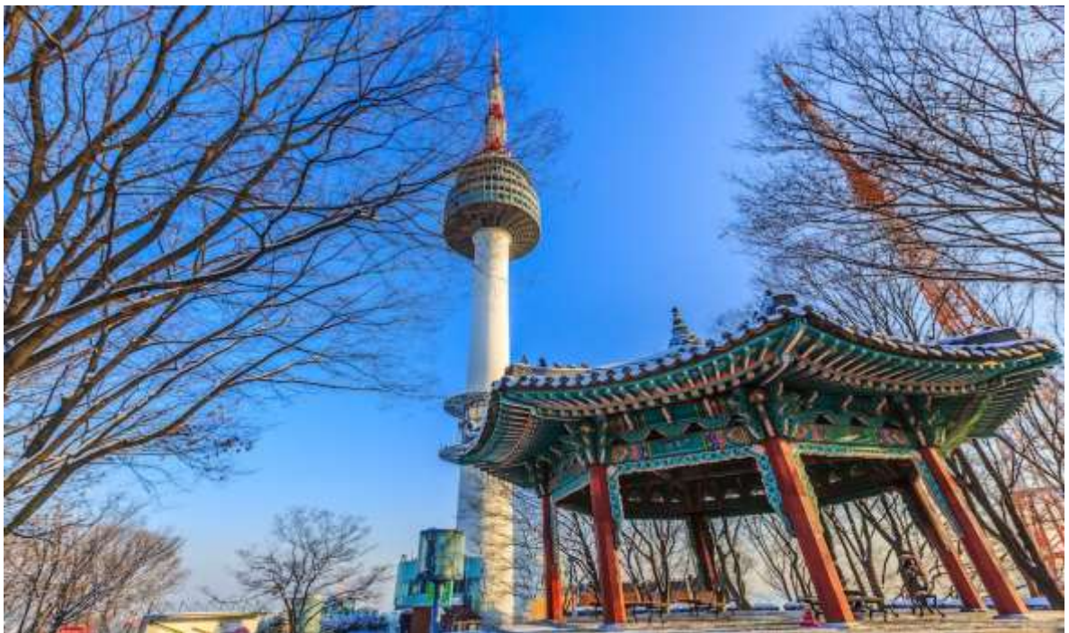
นำท่านเดินทางสู่ ภูเขาหน้าซาน เป็นที่ตั้งของ หอคอยเอ็น โซล ทาวเวอร์ (N SEOUL TOWER)

เช้า บริการอาหารเช้า ณ ห้องอาหารของโรงแรม (6)