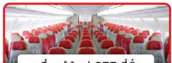
เครื่องลำใหญ่ 377 ที่นั่ง

02.40 น. ออกเดินทางสู่ ประเทศเกาหลีใต้ โดยสายการบิน AIR ASIA X เที่ยวบินที่ XJ700 (ไม่มีบริการอาหารและเครื่องดื่มบริการบนเครื่องบิน ใช้ระยะเวลาในการเดินทางประมาณ 5.25 ชั่วโมง) (ขอสงวนสิทธิ์ในการเลือกที่นั่งบนเครื่องบิน เนื่องจากต้องเป็นไปตามระบบของสายการบิน)