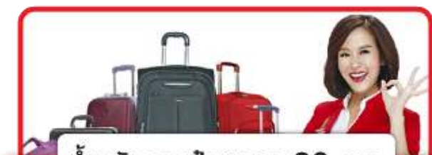
น้ำหนักกระเป๋าสูงสุด 20 ก.ก.

**หากต้องการอัปเดตที่นั่งบนเครื่องบินที่ท่านติดต่อเพื่อทำการเช็คที่นั่ง อัตราการให้บริการดังนี้**