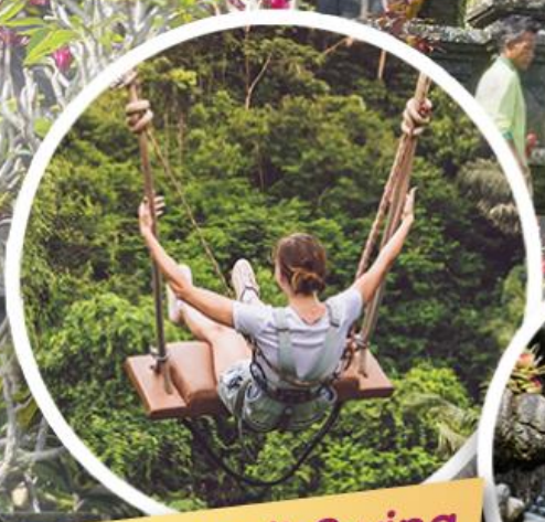
สนุกกับ Bali Swing