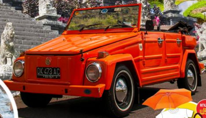
นั่งรถ Volkswagen Safari