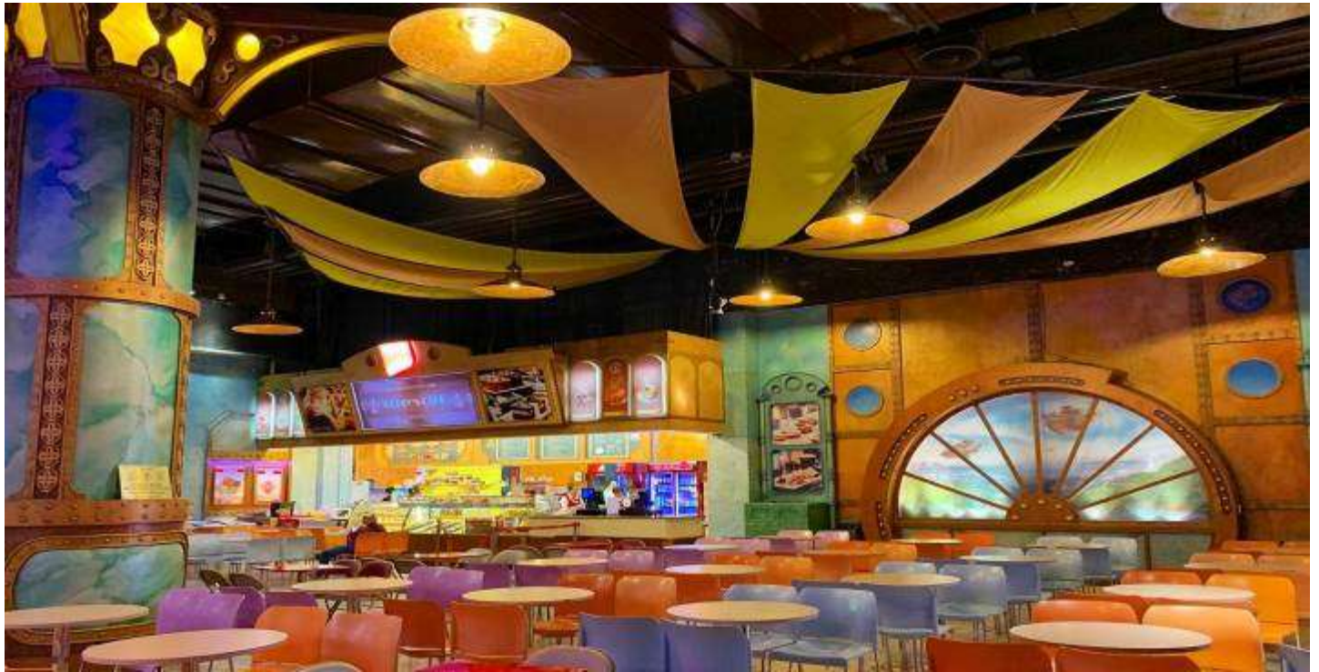
ค่า บริการอาหารค่ำ ณ ภัตตาคารบนบาน่า ฮิลล์ อาหารแบบบุฟเฟต์ (4) พักที่ MECURE BANA HILLS FRENCH VILLAGE บนบาน่าฮิลล์ เป็นรีสอร์ตหรูตั้งอยู่บนเขามาน่า ฮิลล์