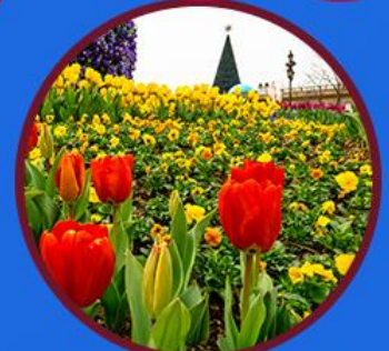
สวนดอกไม้บานาฮิลล์

เต็มอิม Buffet อาหารนานาชาติ และเพลิดเพลินกับ บรรยากาศสุดฟิน บนยอดเขา บานาฮิวล์ 2 วันเต็ม