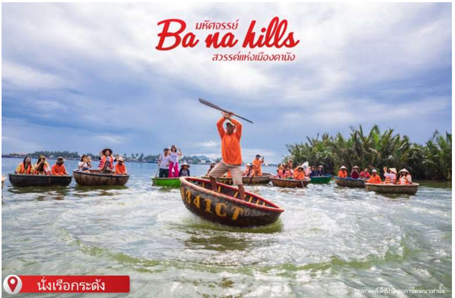
📍 นั่งเรือกระด้ง

📍บริการอาหารเช้า ณ ห้องอาหารโรงแรม เดินทางสู่เมืองโบราณฮอยอัน เมืองฮอยอันนั้นอดีตเคยเป็นเมืองท่าการค้าที่สำคัญแห่งหนึ่งในเอเชียตะวันออกเฉียงใต้และเป็นศูนย์กลางของการแลกเปลี่ยนวัฒนธรรมระหว่างตะวันตกกับตะวันออกองค์การยูเนสโกได้ประกาศให้ฮอยอันเป็นเมืองมรดกโลกทางวัฒนธรรมเนื่องจากเป็นสถานที่สำคัญทางประวัติศาสตร์ แม้ว่าจะผ่านการบูรณะขึ้นเรื่อยๆแต่ก็ยังคงรูปแบบของเมืองฮอยอันไว้ได้