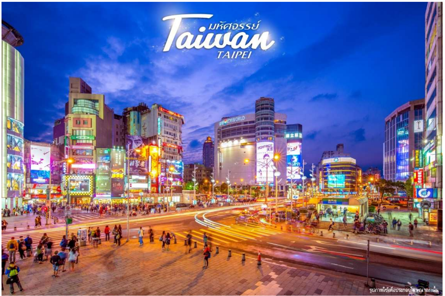
รูปภาพใช้เพื่อประกอบโฆษณาเท่านั้น

คำ นำท่านเดินทางสู่ ซีเหมินติง(อิสระอาหารค่ำตามอัธยาศัย) หรือที่คนไทยรู้จักกันในนาม สยามสแควร์แห่งไทเป เป็นย่านช้อปปิ้งของวัยรุ่นและวัยทำงานของไต้หวัน ยังเป็นแหล่งช้อปปิ้งของนักท่องเที่ยวด้วยเช่นกัน ในย่านนี้เป็นถนนคนเดิน โดยแบ่งโซนเป็นสีต่างๆ เช่น แดง เขียว น้ำเงิน โดยสังเกตจากเสาข้างทางจะมีการระบุหมายเลข และทำสีไว้อย่างเป็นระเบียบ ร้านค้าแนะนำสำหรับนักท่องเที่ยวชาวไทย ซึ่งราคาถูกกว่าไทยประมาณ 30 % ได้แก่ ONITSUKA TIGER , NEW BALANCE , ADIDAS , H&M , MUJI ซึ่งรวมสินค้ารุ่นหายากและราคาถูกมากๆ