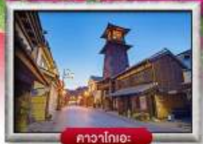
คาวาโกเอะ