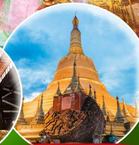
พระธาตุมุเตา

สักการะ 9 สิ่งศักดิ์สิทธิ์ ที่ต้องห้ามพลาด