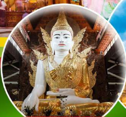
พระหงากัตติ