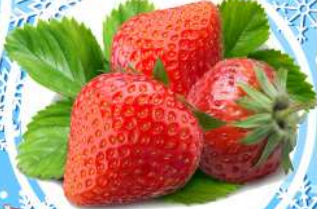
โรสตรอเบอร์รี่