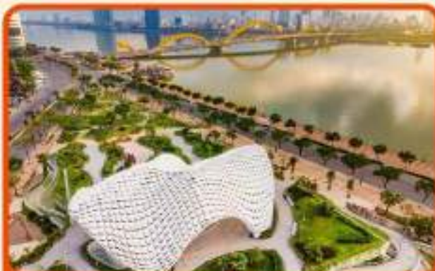
เช็किन แหล่งที่เที่ยวใหม่ APEC PARK