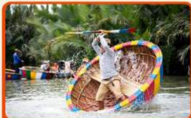
พิเศษ !!! นั่งเรือกระดิง UNSEEN เวียดนาม