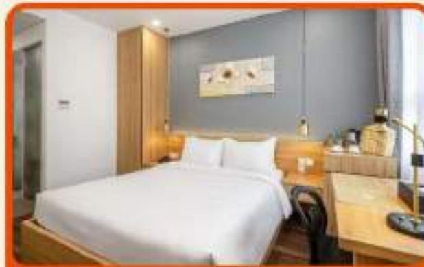
พักเมืองดานัง 4 ดาว 3 คืน