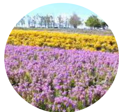
Aurora flower Graden