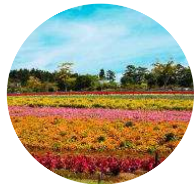
Rainbow Flower Garden

ซึ่งภายในสวนบีกะโนะซาโตะแห่งนี้เปิดให้เข้าชมทุกฤดูกาล ซึ่งฤดูร้อนช่วงปลายเดือนเมษายนเป็นต้นไปจนถึงเดือนพฤษภาคมจะเป็นทุ่งดอกฟิงค์มอส และสวนดอกทิวลิป มากมายหลากหลายสายพันธุ์ให้ทุกท่านได้เลือกชม นอกจากนี้ธีมพาร์คแห่งนี้จะเป็ฯสวนดอกไม้แล้วนั้น ยังมีโซนอื่นๆให้ท่านได้เลือกชมอีกด้วยไม่ว่าจะเป็นสวนสัตว์ กิจกรรมเวิร์คช็อป และคาเฟ่ ร้านน่ารักๆต่างๆมากมายให้ท่านได้เลือกตามอัธยาศัย