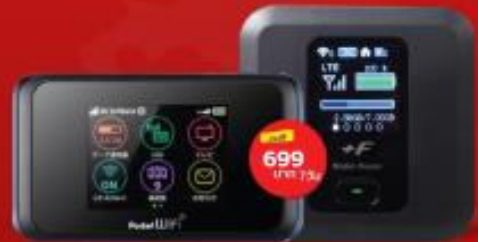
POCKET WIFI สำหรับนำมือถือไปใช้ที่ประเทศญี่ปุ่น และฮ่องกง