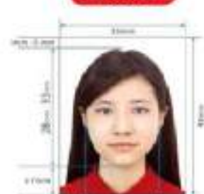
35mm x 45mm Paper Photo for Visa Application Form