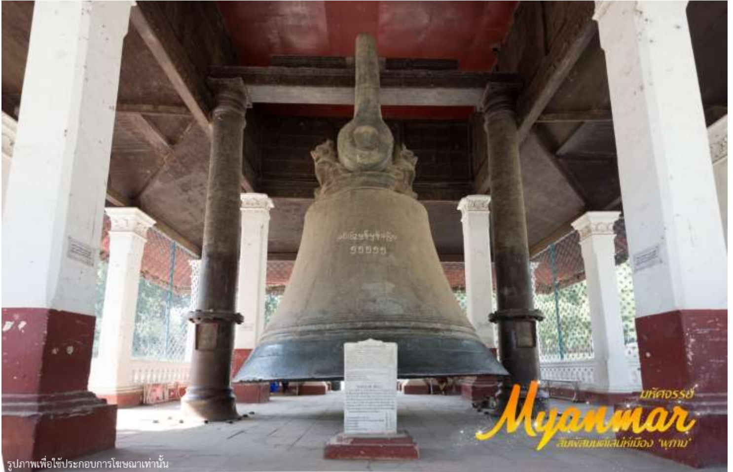
รูปภาพเพื่อใช้ประกอบการโฆษณาเท่านั้น

คือระฆังมิ่งกุนพระเจ้าปดุงโปรดฯให้สร้างโดยสำเร็จ เพื่ออุทิศถวายแด่มหาเจดีย์มิ่งกุน จึงต้องมีขนาดใหญ่คู่ควรกัน คือเป็นระฆังยักษ์ที่มีเส้นรอบวงถึง 10 เมตร สูง 3.70 เมตร น้ำหนัก 87 ตัน เล่าขานกันว่า พระเจ้าปดุงทรงไม่ต้องการให้ มีใครสร้างระฆังเลียนแบบจึงรับสั่งให้ประหารชีวิตนายช่างทันทีที่สร้างเสร็จ ปัจจุบันถือเป็นระฆังยักษ์ที่มีขนาดเล็ก กว่าระฆังแห่งหนึ่งแห่งพระราชวังเครมลินในกรุงมอสโกเพียงใบเดียวทว่าระฆังเครมลินแตกร้าวไปแล้วชาวพม่าจึง ภาคภูมิใจว่าระฆังมิ่งกุนเป็นระฆังยักษ์ที่ยังคงสงเสียดก้องกังวานทั้งนี้เคยมีการทดสอบความกว้างใหญ่ของระฆังใบ นี้ โดยให้เด็กตัวเล็กๆไปยืนรวมกันอยู่ใต้ระฆังได้ถึง 100 คน เจดีย์ชินพิวมิน(เมื่อยะเต็งดาน) ประดิษฐานอยู่เหนือ ระฆังมิ่งกุนไม่ไกล ได้ชื่อว่าเป็นเจดีย์ที่สวยงามแห่งหนึ่งสร้างขึ้นในปี พ.ศ.2359 โดยพระเจ้าบาคะยีดอว์ พระ ราชันดาในพระเจ้าปดุง เพื่อเป็นอนุสรณ์แห่งความรักที่พระองค์มีต่อพระมหาเทวีชินพิวมิน ซึ่งถึงแก่พิราลัยก่อน เวลาอันควร จึงได้รับสมญานามว่า “ทัชมาฮาลแห่งลุ่มอิรวดี” เจดีย์องค์นี้เป็นพุทธศิลป์ที่สร้างขึ้นด้วยภูมิจักรวาลคือ มีองค์เจดีย์สถิตอยู่ตรงกลางณยอดเขาพระสุเมรุอันเชื่อกันว่าเป็นศูนย์กลางและโลกและจักรวาล ล้อมรอบด้วยขุนเขา และมหาสมุทรตามหลักไตรภูมิ หลังจากนั้นเดินทางกลับมายังมีนทะเลย์