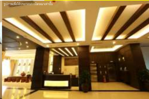
รูปภาพเพื่อใช้ประกอบการโฆษณาเท่านั้น