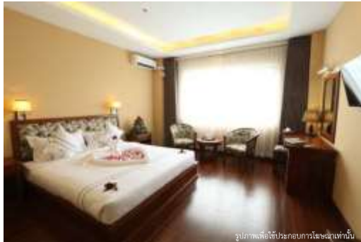
รูปภาพเพื่อใช้ประกอบการโฆษณาเท่านั้น

ค่า 101 บริการอาหารเช้า ณ ภัตตาคาร จากนั้น นำท่านเข้าสู่ที่พัก โรงแรมระดับ 3 ดาว **โรงแรมระดับ 3 ดาว HOTEL YI LINK MANDALAY หรือเทียบเท่า