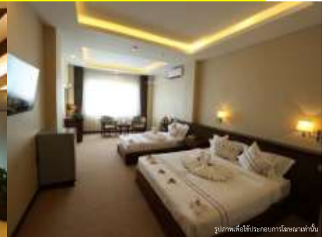
รูปภาพเพื่อใช้ประกอบการโฆษณาเท่านั้น

วันที่สาม มัณฑะเลย์-เที่ยวเมืองมิงกุน-หมู่บ้านมิงกุน-เจดีย์มิงกุน-ล่องแม่น้ำอิรวดี-ระฆังมิงกุน-พระราชวังมัณฑะเลย์ พระราชวังไม้สักขเวนาหนอง 101 (เช้า/กลางวัน/เย็น)