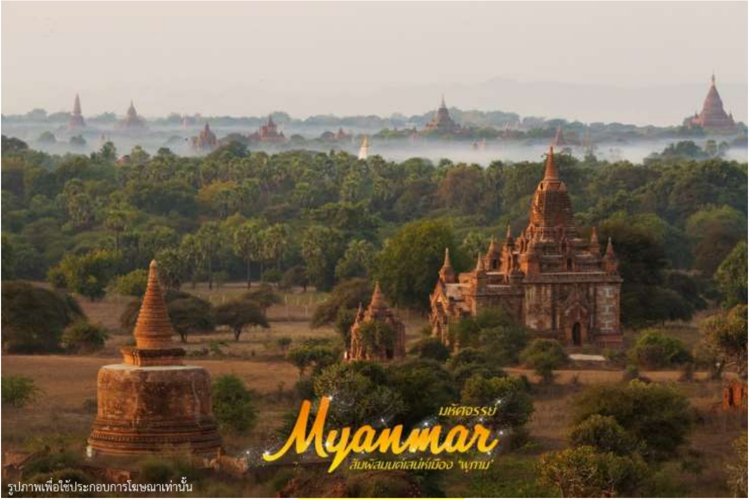
รูปภาพเพื่อใช้ประกอบการโฆษณาเท่านั้น

ค่า ๑๐ | บริการอาหารเย็น ณ ภัตตาคาร พร้อมชมโชว์เชิดหุ่นกระบอก ท่านจะได้ชมการเชิดหุ่นที่ดูเหมือนมีชีวิตจริง พร้อมลิ้มรสอาหารพื้นเมือง