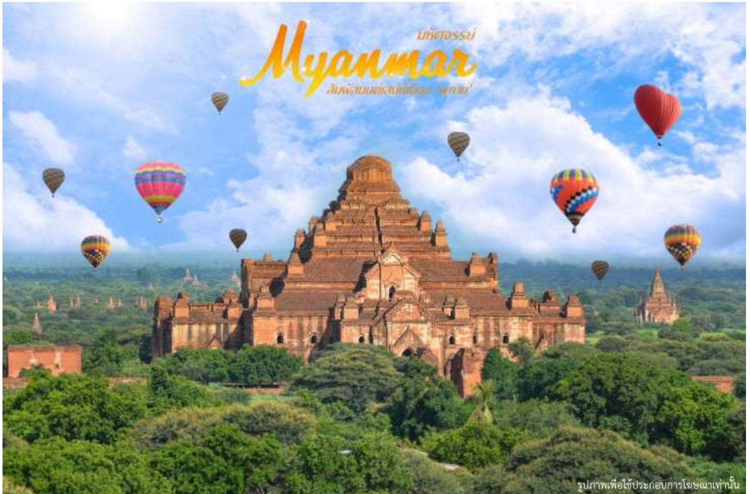
รูปภาพเพื่อใช้ประกอบการโฆษณาเท่านั้น

ค่า 101 บริการอาหารเช้า ณ ภัตตาคาร จากนั้น นำท่านเข้าสู่ที่พัก โรงแรมระดับ 3 ดาว **โรงแรมระดับ 3 ดาว HOTEL YI LINK MANDALAY หรือเทียบเท่า