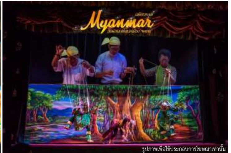
รูปภาพเพื่อใช้ประกอบการโฆษณาเท่านั้น

จากนั้น นำท่านเข้าสู่ที่พัก โรงแรม SU TIEN SAN HOTEL หรือเทียบเท่า