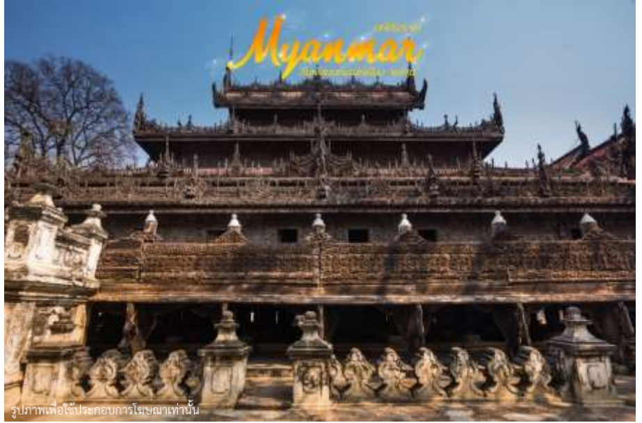
รูปภาพเพื่อใช้ประกอบการโฆษณาเท่านั้น

ศิลปะพม่าแท้ๆ วิจิตรตระการ ด้วยลวดลายแกะสลักประณีต อ่อนช้อย ทั้งหลังคา บานประตู และหน้าต่าง โดยเน้น รายละเอียดเกี่ยวกับพุทธ ประวัติและทศชาติของ พระพุทธเจ้า สร้างโดยพระเจ้า มินดงในปี พ.ศ. 2400 ซึ่งเป็น ปีที่พระองค์ย้ายราชธานีจาก อมรปุระ มาอยู่ที่เมือง มัณฑะเลย์เพื่อเป็นตำหนักยาม