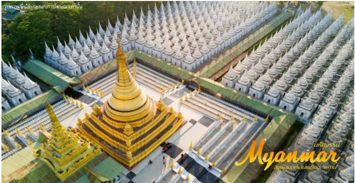
รูปภาพเพื่อใช้ประกอบการโฆษณาเท่านั้น

แปรพระราชฐาน แต่หลังจากที่พระองค์สิ้นพระชนม์ พระเจ้าธิบอ หรือ สีปอ พระโอรสก็ทรงยกวังนี้ถวายเป็นวัด ถือได้ว่าเป็นงานฝีมือที่ประณีตของช่างหลวงชาวมัณฑะเลย์อย่างแท้จริง นำท่านชม วัดกุโสดอ (Kuthodav Pagoda) ซึ่งครั้งหนึ่งเคยเป็นสถานที่ทำการสังคายนาพระไตรปิฎกครั้งที่ 5 มีแผ่นศิลาจารึกพระไตรปิฎกทั้งหมด 84,000 พระธรรมขันธ์ และหนังสือกินเนสบุ๊กรับบันทึกไว้ว่า “หนังสือที่ใหญ่ที่สุดในโลก”