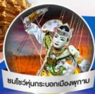
ชมโชว์หุ่นกระบอกเมืองพุกาม