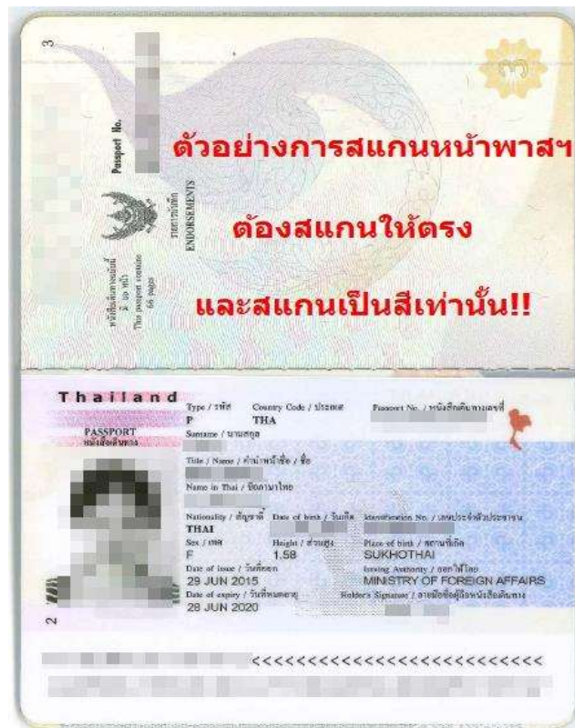
พาสปอร์ตต้องถ่ายให้ติดทั้ง 2 หน้า แบบตัวอย่าง