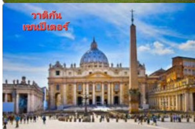
วาติกัน เซนต์ปีเตอร์

ได้เวลาอันสมควร ..นำท่านเดินทางสู่สนามบิน เพื่อเดินทางกลับสู่ ประเทศไทย