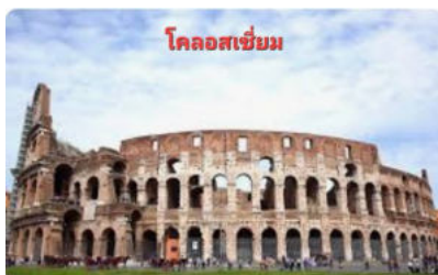
โคลอสเซียม

...ชม น้ำพุเทรวี จุดกำเนิดของเสียงเพลง ทรีคอยน์ออฟเดอะฟาวด์เท่น ที่โด่งดัง ชมความสวยงามของงานประติมากรรมหินอ่อนแบบบาร็อก ซึ่งเป็นเรื่องราวของเทพมหาสมุทร ตามตำนานกล่าวไว้ว่าหากใครได้มาถึงน้ำพุแห่งนี้แล้วโยนเหรียญอธิษฐานทิ้งไว้จะได้กลับมาเยือนกรุงโรมอีกครั้งหนึ่ง ...อิสระ เดินเล่นย่านบันไดสเปน แหล่งพักผ่อนของชาวอิตาลีซึ่งเต็มไปด้วยนักท่องเที่ยวหลากหลายเชื้อชาติ..