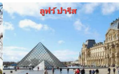
ลูฟว์ปารีส