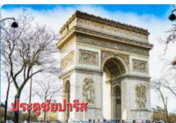
ประตูดัชชี่ปารีส