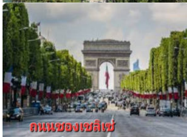
ถนนชองเซลีเซ่