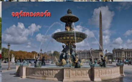
จัตุรัสคองคอร์ด