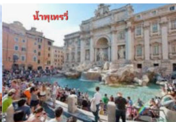
น้ำพุเทรวี