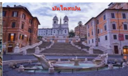
บันไดสเปน