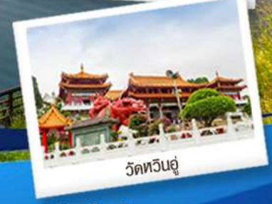
วัดหวินอู๋