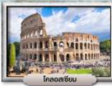
โคลอสเซียน

✓ เที่ยวชมบ้านเกิด ตำนานรัก จูเรียต โรเมโอ