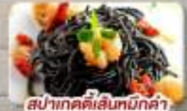
สปาเกตตีเส้นหมึกดำ