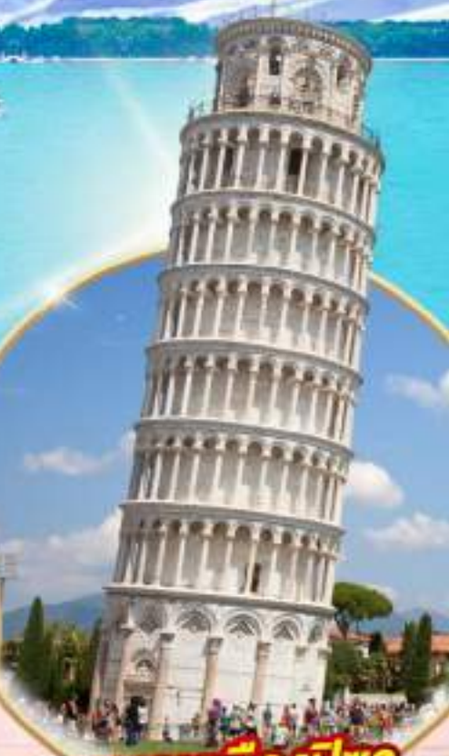
หออนเมืองปิซา

เที่ยวเวนิส ราชนิแห่งทะเลเอเดรียติก ดินแดนแสนโรแมนติก