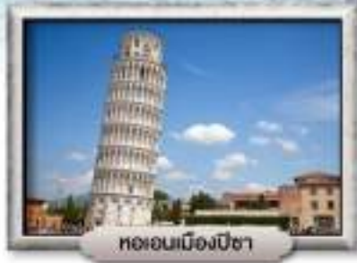
ทOWERเมืองปิซา

พิเศษ! สปาเกตตีเส้นหมึกดำ, พิชซ่าสโตร์อิตาลีเยี่ยมแท้