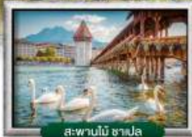
สะพานไม้ ซาเปลา