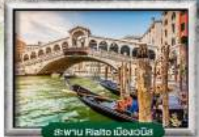
สะพาน Rialto เมืองเวนิส

พิเศษ! หอยแครงสด + ไวน์แดงฝรั่งเศส | ชีสฟองดูสวิตเซอร์แลนด์ สปาที่คฤหาสน์หรูแบบเวนิส