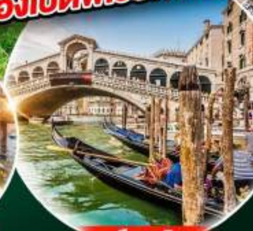
เมืองเวนิส