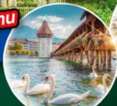
ส-พานมิ ซาเปลา