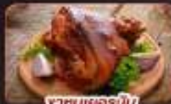
ขาหมูเยอรมัน