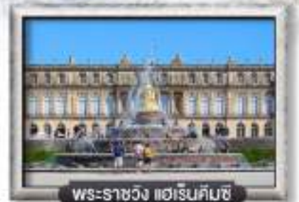
พระราชวัง แอเรนคิมซ์

เมนู พิเศษ! ขาหมูเยอรมัน, ฟองดูว์ 3 ชนิด