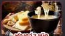
ฟองดูว์ 3 ชนิด