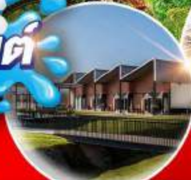
The Mall Firenze