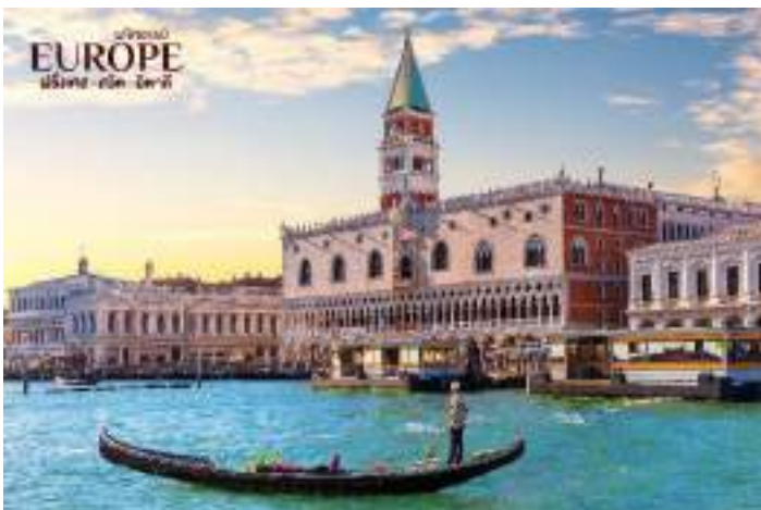
ท้องถนนที่ใช้คลองแทนถนน

นำท่านเดินทางสู่ ท่าเรือตรอนเกตโต้ (Tronchetto) นำท่านล่องเรือผ่านชมบ้านเรือนของชาวเวนิส สู่เกาะเวนิสหรือเวเนเซีย (VENEZIA) ดินแดนแสนโรแมนติก เป็นเมืองที่ไม่เหมือนใคร โดยใช้เรือแทนรถ ใช้คลองแทนถนน มีสมญานามว่าเป็น “ราชินีแห่งทะเลเอเดรียติก” มีเกาะน้อยใหญ่กว่า 118 เกาะ และมีสะพานเชื่อมถึงกันกว่า 400 แห่ง ขึ้นฝั่งที่บริเวณ ซานมาร์โก ศูนย์กลางของเกาะเวนิส นำท่านเดินชมความงามของเกาะเวนิส จากนั้นนำท่านถ่ายรูปบริเวณ จัตุรัสเซ็นต์มาร์ค (St. Mark's Square) ที่จักรพรรดิโนโปเลียนยกย่องว่าเป็นห้องรับแขกที่สวยงามที่สุดของยุโรป และยังเป็นที่ตั้งของ มหาวิหารซันมาร์โก (San Marco Basilica) มหาวิหารประจำเขตอัครบิดรเวนิส สร้างขึ้นในแบบสถาปัตยกรรมไบแซนไทน์ซึ่งหาได้ยากในปัจจุบัน เนื่องจากถูกทำลายไปเกือบหมดสิ้นในครั้งที่ออกโตมันเข้ายึด ซึ่งภายในโบสถ์นั้นจะมีภาพโมเสกบอกเล่าเรื่องราวในครั้งนั้นอยู่ โดยเซ็นต์มาร์โกถือว่าเป็นนักบวชที่สำคัญในการเผยแพร่ศาสนาในสมัยศตวรรษที่ 5 สำหรับตัวมหาวิหารจะเชื่อมกับ พระราชวังดอร์จ (Doge's Palace) พระราชวังแบบเวนิส-โกธิค ที่ครั้งหนึ่งเคยเป็นที่ประทับของยุคแห่งเวนิสครั้งที่เมืองนี้ยังเป็น สาธารณรัฐเวนิส ก่อนได้รับการปรับปรุงเป็นพิพิธภัณฑ์และเปิดอย่างเป็นทางการในปี 1923 และยังมี หอรฆังซันมาร์โก (St