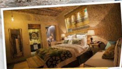
พักโรงแรมห้า 1 คืน