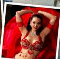
ชมโชว์ระบำหน้าท้อง