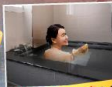
แช่ออนเซ็นส่วนตัวในห้องพัก