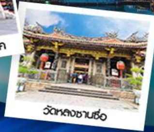
วัดหลงชานซื่อ