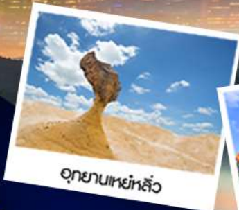
อุทยานเหยี่ยวหลิว

ม.ค. 63 : 09-13 / 16-20 / 31 ม.ค.-04 - ก.พ. ก.พ. 63 : 06-10 / 07-11 / 13-17 / 20-24 / 27 ก.พ.-02 มี.ค. มี.ค. 63 : 05-09 / 06-10 / 12-16 / 13-17 / 19-23 / 26-30 พ.ย. 63 : 02-06 / 03-07 / 09-13 / 10-14 / 11-15 / 13-17 / 14-18 / 16-20 / 17-21 / 23-27 พ.ค. 63 : 07-11 / 14-18 / 28 พ.ค. - 01 มิ.ย. มิ.ย. 63 : 02-06 / 03-07 / 11-15