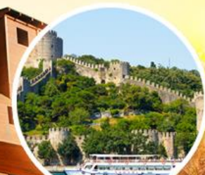
ล่องเรือชม ช่องแคบบอสฟอรัส