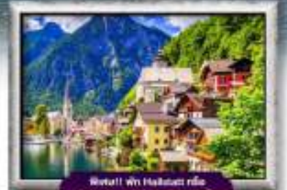
วิว!!! ฟัน Hallstatt หรือ St. Wolfgang บนทะเลสาบ 1 กับ

พิเศษ!! ลิ้มลองเมนูประจำชาติ ทั้ง 5 ประเทศ!!!