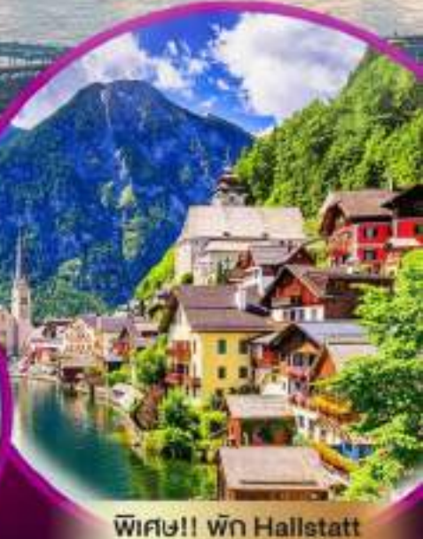
พิเศษ!! พัก Hallstatt หรือ St.wolfgang ริมทะเลสาบ 1 คืน