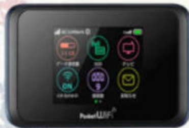
POCKET WIFI สำหรับนำไปใช้ในประเทศญี่ปุ่น