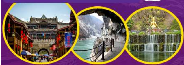
เมืองโบราณต้าหลี่ ช่องแคบเสือกะโจน อุทยานน้ำหยก