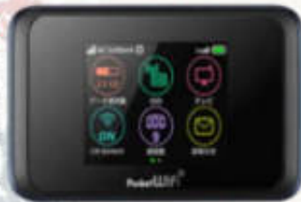
POCKET WIFI สำหรับนำไปใช้ในต่างประเทศ