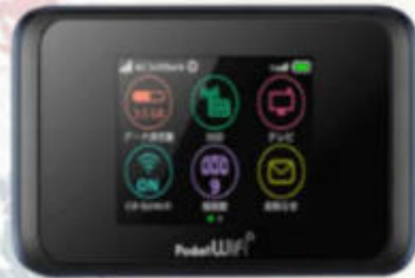
POCKET WIFI สำหรับนำไปใช้ที่ประเทศญี่ปุ่น