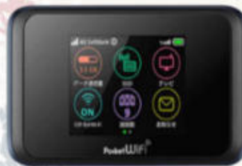
POCKET WIFI สำหรับนำไปใช้ที่ประเทศญี่ปุ่น