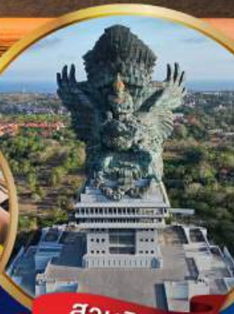
สวนวิษณุ