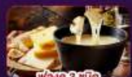
พองตุ 3 ชนิด

พิเศษ! พักชอแมท เมือง Car Free • น้ำตกโรมัน • เจนีวา • Unseen เมืองชไตน์ อิม ไรน์