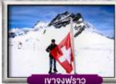
เขาจุงเฟรา