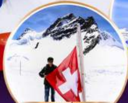
เขาจุงเฟรา ใหม่ ขึ้นกระเช้า สดงไฟ

8 วัน 5 คืน เดินทาง 4-11 / 11-18 เม.ย. 66