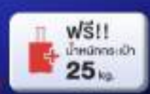
ฟรี! เบ้าหนัก 25 kg.