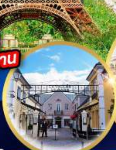
La Vallee Village Outlet