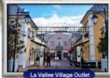
La Vallee Village Outlet