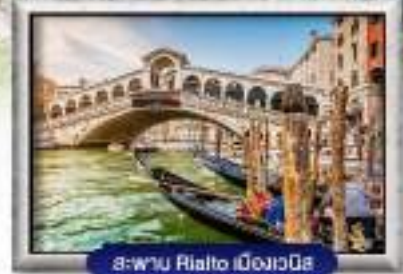
สะพาน Rialto เมืองเวนิส

พิเศษ! หอยเชลล์สด • ไวน์แดงฝรั่งเศส | ซีสฟองดูสวิตเซอร์แลนด์ สปาเก็ตตี้เย็นหมักแบบเวนิส