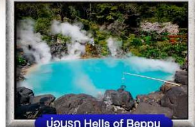
บ่อน้ำ Hells of Beppu

พิเศษ! บุปเฟ่ต์ยากินิคู, สุกียากี้ สไตลญี่ปุ่น