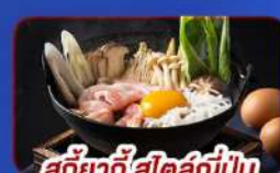
สุกียากี้สไตล์ญี่ปุ่น