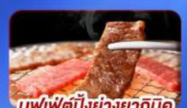
บุฟเฟ่ต์ปิ้งย่างยากินุกุ