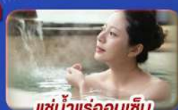
แช่น้ำแร่ร้อนเซ็น