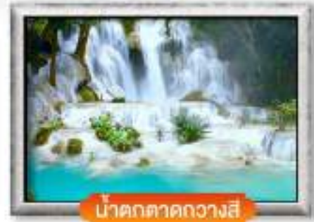
น้ำตกตาดกวางสี