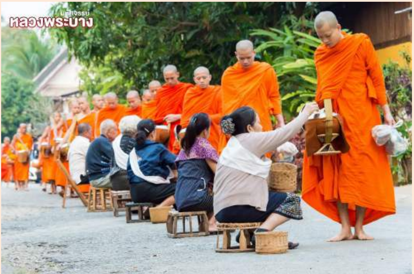
บึงกระเทียม หลวงพระบาง

09.00น. ๑๑ บริการอาหารเช้า ณ ห้องอาหารโรงแรม