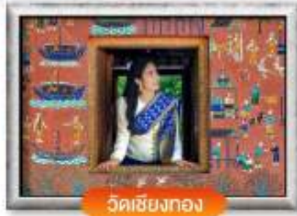
วัดเชียงทอง