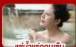
แช่น้ำแร่ร้อนเซ็น