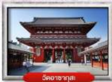
วัดฮาซาฮาระ