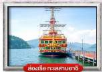
ล่องเรือ ทะเลสาบอาชิ