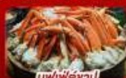
ซูฟุพีคังปู