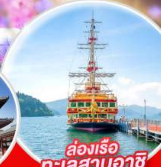
ล่องเรือ ทะเลสาบอาชิ