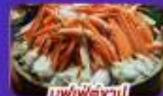
บุฟเฟ่ต์ซาปู