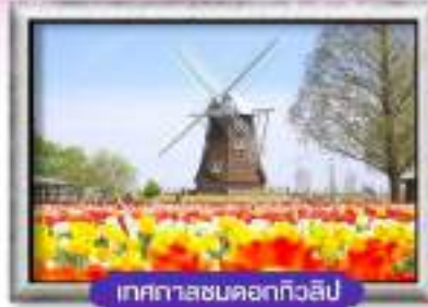
เทศกาลชมดอกทิวลิป