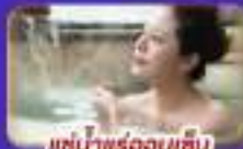
แช่น้ำแร่ร้อนนชิบ