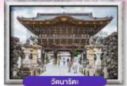
วัดนาริตะ