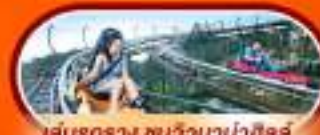
เล่นรถราง ชมวิวบานาฮิลล์

นั่งกระเช้าที่ยาวที่สุดในโลก ขึ้นสู่บานาฮิลล์ ฮอยอัน เมืองมรดกโลกที่สวยงามและเจียบสงบ