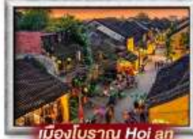
เมืองโบราณ Hoi an