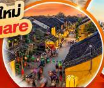
เมืองโบราณ Hoi an