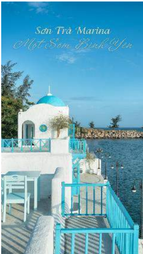
Son-Trà Marina Mot Siam Beach-Yes