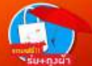
ช้อปปิ้งที่ร้านกาแฟ