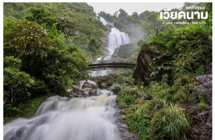
บริษัทจรรยา เวียดนาม ฮานอย • ฟานซิปัน • วัดตานจุก

นำท่านเดินทางไปชมน้ำตก Silver Water Fall (น้ำตก ThacBac) น้ำตกสีเงิน ที่ขึ้นชื่อในเมืองซาปา จากนั้นนำท่านชม สะพานแก้วมังกรเมฆ Rong May Glass Bridge เป็นสะพานแก้วใสแห่งแรกในประเทศเวียดนาม ท่านจะได้สัมผัสกับบรรยากาศแบบวิวพาโนรามา 360 องศา ท่ามกลางความสูงจากระดับน้ำทะเล 2,000 เมตร มีระบบลิฟต์แก้วใสสูงถึง 300 เมตร ชมทัศนียภาพได้สุดลูกหูลูกตา