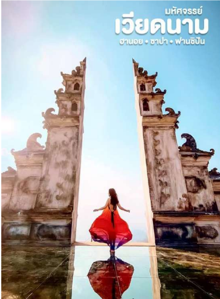
บริษัทจรรยา เวียดนาม ฮานอย • ซาปา • ฟานซิปัน