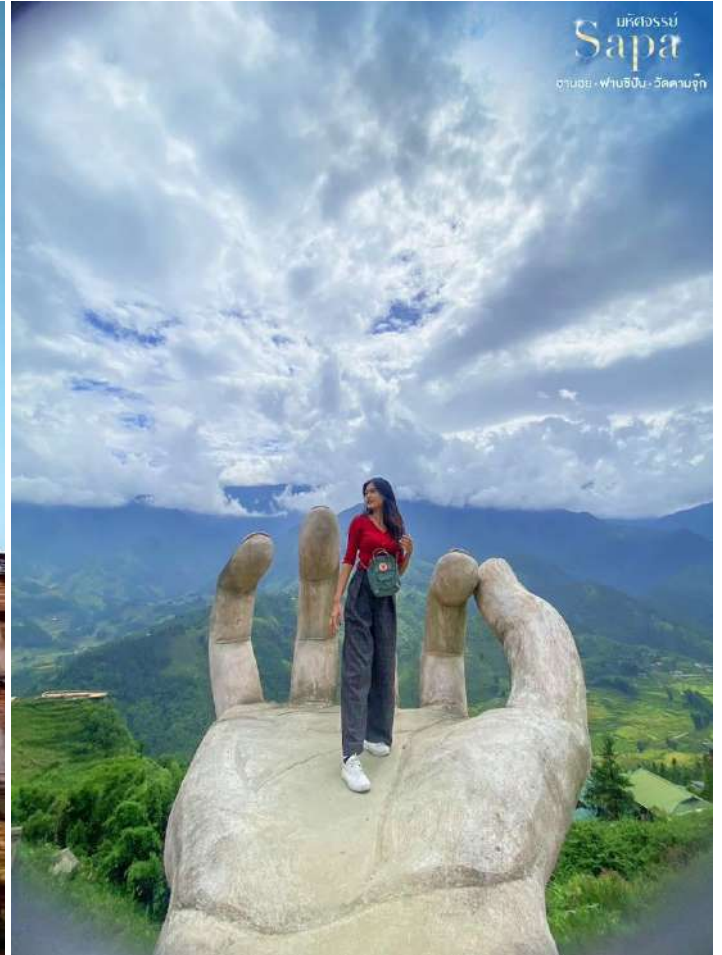
บริษัทจรรยา Sapa ฮานอย • ฟานซิปัน • วัดตานจุก