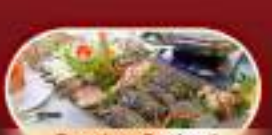
Premium Seafood Hotpot Boatget