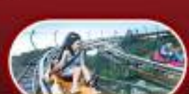
เล่นรถราง ชมวิวบาน่าฮิลล์