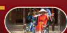
นั่งรถซิกโก้ ชมเมืองเว้