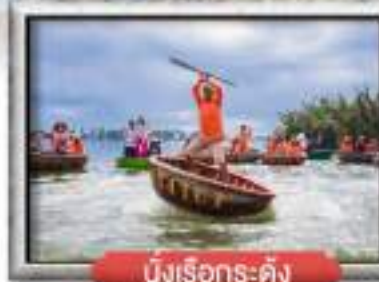
นึ่งเรือกระด้ง