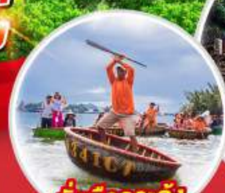
นั่งเรือกระดิ่ง Hoi An