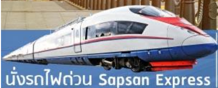
นั่งรถไฟด่วน Sapsan Express

ป้อมปีเตอร์แอนด์ปอลด์ มหาวิหารเซนต์ไอแซค โบสถ์อัสสัมชัญ ยอดเขาสเปร์โรวีซิล มหาวิหารเซนต์บาซิล พระราชวังเครมลิน พิพิธภัณฑ์อาร์เมอริี่แซมเบอร์